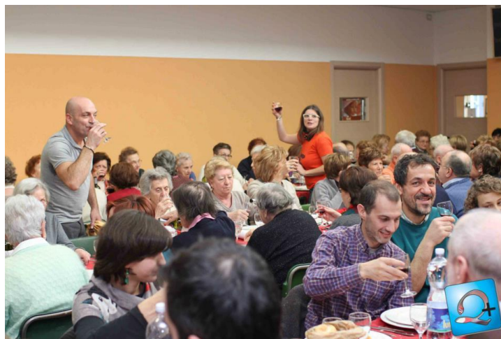
Una delle scorse edizioni

Come ormai da diversi anni l’Associazione “Qualcosa in più” organizza un pranzo solidale presso il Salone della Parrocchia di S.Francesco. ABC sostiene questa iniziativa, un’ottima occasione per gli abitanti del quartiere di incontrarsi, conoscersi meglio e condividere piacevoli momenti in buona compagnia.